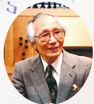
わたなべ かくじ 講師：渡邊學而(音楽評論家)

慶応義塾大学経済学部卒業後、フリーの音楽評論家として、NHKの音楽番組の解説や、各新聞、雑誌への執筆などを行ってきた。音楽の啓蒙家として誰にでも親しめる分かりやすい音楽解説に、これまで音楽にあまり興味を持っていなかった受講者も多い。